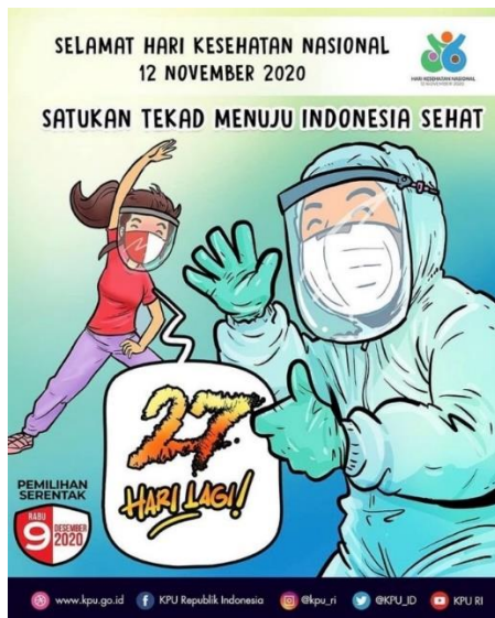
Gambar 1. Poster Pilkada KPU 2020, seri Hari Kesehatan Nasional.

Poster ini mengandung 2 pesan, yaitu: (1) memperingati Hari Kesehatan Nasional yang jatuh pada tanggal 12 November 2020, dan (2) sebagai informasi pengingat bagi masyarakat bahwa 27 hari lagi (terhitung sejak poster ini dipublikasikan) berlangsung Pilkada. Kedua pesan tersebut didukung dengan adanya elemen verbal serta visual yang ditampilkan pada poster.