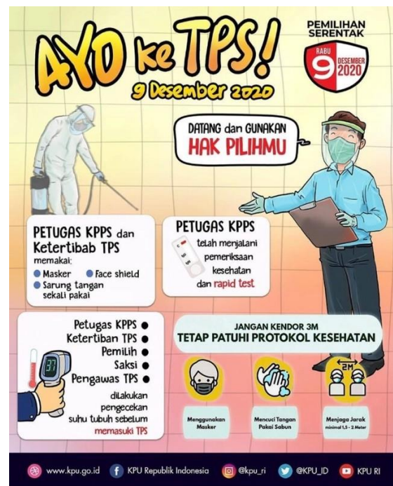
Gambar 3. Poster Pilkada KPU 2020, seri Ayo ke TPS!

Poster pilkada KPU seri Ayo Ke TPS! Ini juga merupakan poster resmi keluaran KPU Indonesia. Dapat dibuktikan dengan adanya mandatoris berupa logo resmi Pilkada 2020 dan alamat resmi akun media sosial KPU.