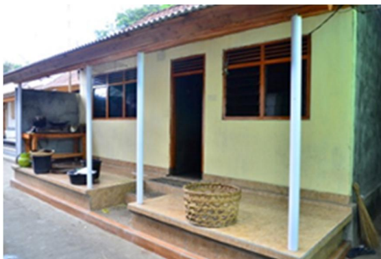
Gambar 5. Ruang teras menjadi bagian terpenting pada penampilan bangunan sehingga bahan bangunan yang paling up-to-date selalu dipilih untuk menggantikan model sebelumnya.

dengan fungsinya sebagai penyalur beban bangunan ke tanah. Bentuk dan lebar bukaan jendela semakin beragam karena teknologi membangun yang makin baik dan ketersediaan bahan kaca yang makin mudah. Dengan finishing yang modern, keberadaan ruang teras semakin mencolok sebagai wajah bangunan yang representatif. Sejalan dengan perubahan tersebut tipologi rumah berteras menjadi tradisi baru dan ruang teras menjadi pusat perhatian pemilik dalam merepresentasikan selera dan status sosialnya.