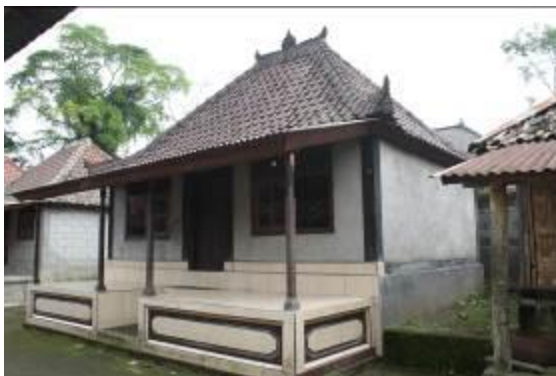
Gambar 6. Masyarakat menjadi lebih bebas dan berani mengungkapkan selera pribadi pada saat merenovasi rumah. Sumber: Himasari Hanan, 2014