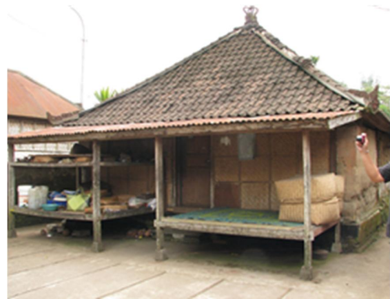
Gambar 13. Sepasang balé-balé di depan rumah identik dengan yang di dalam rumah. Tata guna balé-balé mengikuti arah mata angin.

Signifikansi balé-balé sebagai komponen pembentuk ruang di dalam bangunan tidak hanya ditemui pada bangunan rumah tinggal saja. Pada bangunan yang bersifat publik seperti bangunan ibadah di kompleks pura, terlihat juga bagaimana balé-balé menciptakan ruang dan bentuk. Bangunan ibadah yang terbesar yang dikenal sebagai Balé Agung, terbentuk dari dua balé-balé yang dijejerkan pada arah memanjang bangunan. Di antara dua balé-balé tersebut ada jarak yang memisahkan keduanya sehingga memperlihatkan penggunaan prinsip yang sama: sepasang balé-balé menentukan batasan ruang dan bentuk bangunan. Sebagaimana halnya balé-balé di dalam rumah terletak di atas lantai bangunan, maka Balé Agung