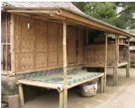
Gambar 1. Bangunan asal yang terbuat dari bambu dipadukan dengan balé-balé bambu beratap membentuk unit rumah tinggal

Bentuk dan ruang dalam rumah disusun dari komponen-komponen bangunan yang mandiri untuk kemudian digabungkan sesuai kebutuhan fungsinya. Masing-masing komponen diekspresikan kemandiannya tanpa mengganggu keberadaan komponen lainnya. Bentuk bangunan dengan demikian terjadi secara alami dengan penuh kejujuran sesuai kebutuhan yang ada. Struktur penyangga atap memang terpisah dari struktur balé-balé namun keduanya dipadukan secara utuh sehingga balé-balé seolah menyatu dengan atapnya. Bahan yang homogen memperkuat kesan kesatuan bangunan utama dan balé-balé yang beratap menjadi satu unit bangunan rumah tinggal.