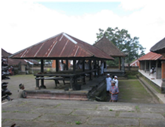
Gambar 14. Balé Agung sebagai bangunan suci menggunakan tata atur balé-balé dalam pembentukan ruangnya. Sifat bangunan yang suci diperlihatkan melalui sistem hirarki ruang yang serupa dengan bangunan rumah tinggal. Ketinggian lantai di bawah balé-balé menunjukkan tingkat kesucian bangunan di atasnya.

Bangunan Balé Agung yang ringan dan transparan berdiri di atas lantai yang masif dari batu bata, membentuk kontras yang menonjolkan keberadaan balé-balé sebagai tempat kegiatan yang suci. Penggunaan ruang pada balé-balé diperuntukkan bagi persiapan sesajian pada upacara ritual dan kegiatan upacara itu sendiri. Balé-balé memiliki ketinggian bidang meja yang lebih tinggi dari balé-balé di rumah tinggal untuk menunjukkan bahwa Balé Agung sebagai bangunan suci memiliki hirarki yang lebih tinggi. Komponen pembentuk ruang adalah sama yaitu balé-balé tetapi penyelesaian desain dan penempatannya berbeda sesuai dengan peran dan fungsinya.