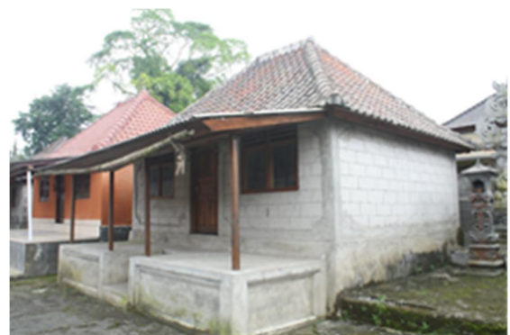
Gambar 4. Sistem konstruksi dinding membuka peluang untuk membuat sistem bukaan dengan konstruksi kayu. Bersamaan dengan itu, konstruksi bambu digantikan oleh kayu dan penutup atap digantikan oleh genteng atau seng.

Tahap berikutnya, masyarakat yang telah meningkat kemampuannya melakukan renovasi rumah dengan mengganti dinding batako exposed dengan finishing keramik atau cat. Lantai semen sekaligus diganti dengan bahan keramik, sedangkan kolom bambu diganti dengan bahan PVC atau kayu berumpak semen. Bahan penutup atap seng tidak berubah namun atap diakhiri dengan papan penutup terbuat dari kayu yang bertumpu pada kolom. Keterpaduan ruang teras dengan bangunan utama kembali mengalami pergeseran karena sistem konstruksi yang tidak sinkron dari segi bahan maupun bekerjanya gaya. Keberadaan kolom menjadi lebih sebagai hiasan daripada struktural karena penempatan dan finishing tidak sesuai