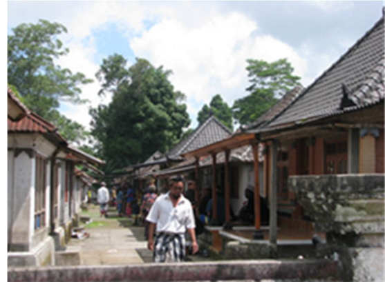
Gambar 8. Ruang teras yang menerus menjadi ruang tamu yang luas pada saat ada kegiatan hajatan di salah satu rumah. Orientasi bangunan yang seragam mengikuti ketentuan adat menghasilkan tata ruang yang linier dan hirarkis.