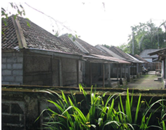
Gambar 7. Deretan ruang teras membentuk ruang transparan untuk melakukan kegiatan yang menerus tanpa batas sehingga mendorong kontak visual dan komunikasi sosial di antara tetangga.

Dari segi kenyamanan termal, ruang teras merupakan tempat yang paling ideal karena angin mengalir tanpa hambatan dan ruang terlindung dari terik matahari. Ruang ini selalu dipakai oleh penghuni rumah untuk bersantai dengan keluarga, berbincang-bincang dan melakukan kegiatan domestik. Di sini orang dapat bebas berbicara maupun berlaku karena tidak ada batasan ruang dan teritori yang tegas. Penghuni suatu rumah yang duduk di ruang terasnya dapat berkomunikasi dengan tetangga sebelah yang sedang duduk di terasnya. Tanpa ada suatu peristiwa khusus orang dapat saling berinteraksi dengan tetangganya yang sama-sama sedang berada di teras. Disamping itu, ruang teras memberikan peluang kontak visual di antara tetangga tanpa harus mengganggu kegiatan masing-masing. Oleh karenanya, keberadaan ruang teras membuat komunikasi antar tetangga menjadi informal karena dapat terjadi kapan saja dan dengan siapa saja. Sebagai ruang antara di dalam dan luar rumah, ruang teras sangat mendukung baik keberlanjutan kehidupan keluarga maupun kehidupan komunal dari masyarakat.