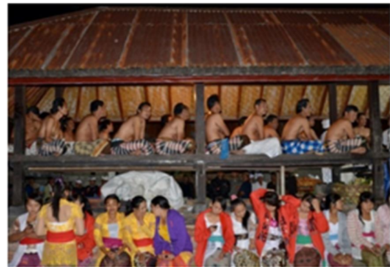
Gambar 16. Balé-balé berfungsi sebagai tempat duduk pemuka masyarakat pada saat upacara ritual keagamaan. Kegiatan di atas balé-balé menciptakan nilai ruang yang terjadi. Pada saat menjadi tempat sesajian balé-balé memperlihatkan nilai ruang yang sakral, sedangkan pada saat dipakai sebagai tempat duduk menjadi ruang fungsional biasa bagi orang-orang yang terpilih. Masyarakat biasa hanya boleh duduk di lantai tempat balé-balé berdiri.