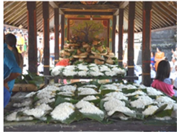
Gambar 15. Balé-balé tetap bersifat multifungsi namun hanya untuk kegiatan yang berkaitan dengan upacara keagamaan. Balé-balé menjadi tempat sesajian ritual selama upacara berlangsung.