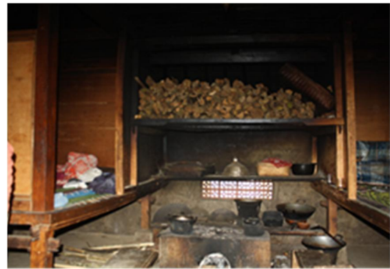
Gambar 12. Sepasang balé-balé yang ditempatkan mengapit tungku di dalam rumah membentuk identitas dapur; Sumber: Himasari Hanan, 2014

Struktur dan konstruksi balé-balé kayu yang serupa diulang di luar bangunan, yang dipergunakan untuk tempat bekerja dan menyimpan barang. Hal ini menunjukkan bahwa balé-balé merupakan komponen penting yang dijadikan pedoman dalam membentuk dan memperluas ruang. Apabila di dalam rumah ada dua balé-balé maka di luar rumah juga dibuat dua balé-balé dengan susunan yang kurang lebih serupa. Kedua balé-balé tersebut ditempatkan pada dua sisi terluar bangunan dan mengapit unsur yang keberadaannya signifikan bagi kelangsungan kehidupan dalam rumah. Di atas balé-balé orang dapat melakukan kegiatan apapun asalkan sesuai dengan peruntukan yang dirumuskan dalam aturan adat. Peraturan adat membangun ketertiban dalam penggunaan balé-balé yang dikaitkan dengan orientasi mata angin, sedangkan penggunaan ruang tidak pernah diatur. Keberadaan ruang tidak pernah dijabarkan, namun melalui pengaturan kegiatan konsep ruang dapat dikenali. Pada saat orang konsisten menerapkan unsur balé-balé sebagai tata atur dalam rumah maka perbedaan kualitas ruang dalam rumah menjadi terungkap.