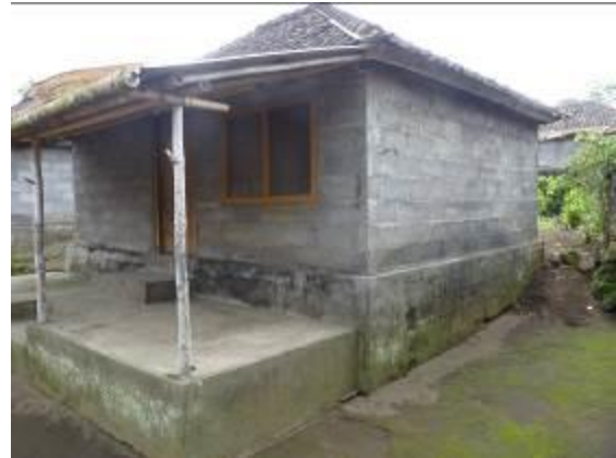
Gambar 3. Ruang teras semakin terpadu dengan bangunan utama melalui bahan yang karakter dan warnanya serupa.

Dengan munculnya bahan batako bagi dinding, yang lebih cepat dan mudah pengerjaannya dibanding bambu, telah mendorong masyarakat Pengotan untuk merenovasi dinding rumah dengan batako exposed . Bersamaan dengan perubahan bahan dinding, bangunan utama mulai mengalami perubahan yang signifikan, yaitu munculnya bukaan jendela di dinding dan perbedaan tinggi lantai di dalam dan luar bangunan. Namun demikian perubahan dinding ini tidak merubah sistem struktur bangunan dan atap. Bagian atap mengalami perubahan dengan digantinya bahan penutup bambu dengan genteng yang lebih tahan lama. Dinding masif dari batako yang warnanya senada dengan lantai semen menghasilkan kesatuan bangunan yang kokoh ( solid ) antara ruang teras dan bangunan induk. Ruang teras kembali berubah perannya menjadi bagian dari bangunan utama secara terpadu. Keberadaan tiang bambu tunggal di sini menjadi janggal dan menunjukkan ketidakpaduan proses pertumbuhan bangunan. Bangunan masif berdinding bata ini telah menggeser citra bangunan tropis sebelumnya yang bersifat ringan dan sangat fleksibel dari segi struktur. Pada saat konstruksi bambu pada atap ruang teras rusak dan harus diganti, bahan kayu menggantikan penggunaan bambu.