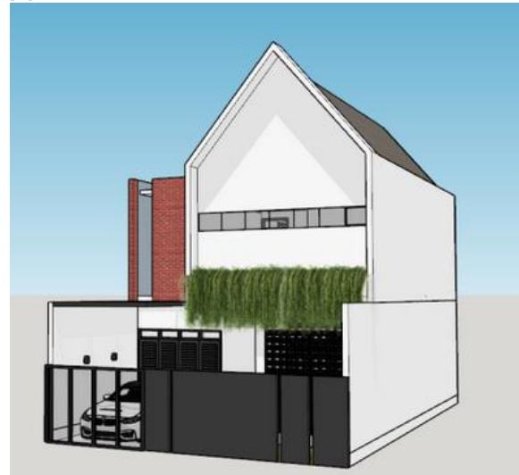
Gambar 2. Obyek pengamatan dalam beberapa orientasi

Simulasi dilakukan dengan empat skenario orientasi bangunan (utara, timur, selatan, dan barat) dan variasi desain jendela. Hasil simulasi menunjukkan bahwa orientasi bangunan dan desain jendela berperan besar dalam pengendalian kenyamanan termal. Pada orientasi utara dengan jendela berukuran kecil dan material kaca berinsulasi tinggi, nilai PMV dan PPD menunjukkan tingkat kenyamanan termal yang lebih baik dibandingkan orientasi barat, di mana jendela besar dengan kaca biasa meningkatkan suhu dalam ruangan secara signifikan [7].