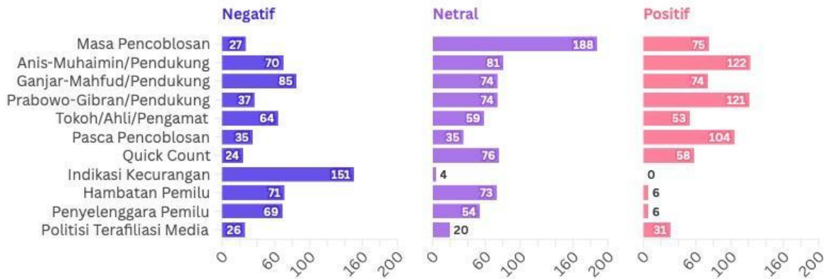
Gambar 3. Sentimen dan Tema Pemberitaan Media Indonesia, iNews dan Viva News

Melalui gambar 3 dapat diketahui bahwa tema Indikasi kecurangan hampir selalu diberitakan dengan sentimen negatif. Indikasi Kecurangan diberitakan dengan 151 berita dengan sentimen negatif, empat berita dengan sentimen netral dan nol berita dengan sentimen positif. Pada tema masa pencoblosan, lebih cenderung diberitakan dengan sentimen netral, dengan 188 berita. Lalu sebabnya 27 berita dengan sentimen negatif dan 75 berita dengan sentimen positif.