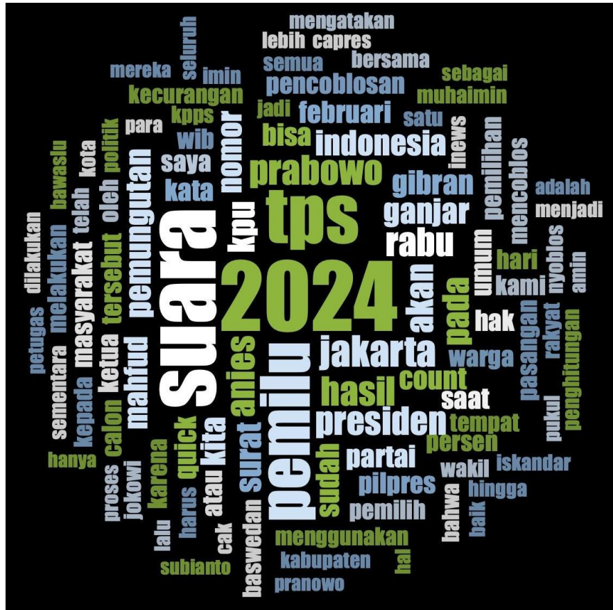
Gambar 4. Word Frequency Pemberitaan Media Indonesia, iNews dan Viva News

Berita yang telah dikategorisasikan temanya dan dilihat sentimennya, selanjutnya peneliti juga mencoba melihat kata yang paling sering digunakan. Dengan menggunakan tools Word Frequency pada Nvivo, didapatkan kata-kata yang paling sering digunakan.